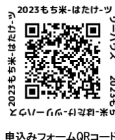
2023もち米-はたけ-ツリーハウス 2023もち米-はたけ-ツリーハウス 申し込みフォームQRコード

* 質問、変更等ある方は、メールでお問い合わせ下さい。 info@kids-village.jp