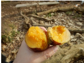
健伸学院 日曜日の自然体験プログラムです。